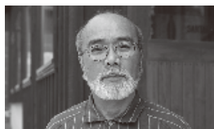
高橋 三太郎 家具工房 santaro