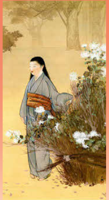
横山大観《秋思》1898(明治31)年

当館は1977年の開館以来、様々な作品を収集してきました。「北海道の美術」、「日本近代の美術」、「エコール・ド・パリ」、「ガラス工芸」、「現代の美術」という五つの方針による収蔵作品は、現在5600点以上を数えます。今年度の近美コレクション展では「コレクション・ストーリーズ」と題したシリーズにより、1年を通して各分野の魅力をあらためて掘り起こします。