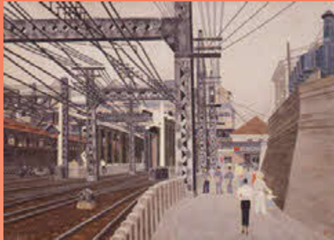
岩橋英遠《駅(青梅口)》1937(昭和12)年