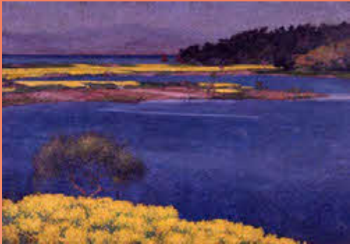
和田英作《菜の花島》1916(大正5)年