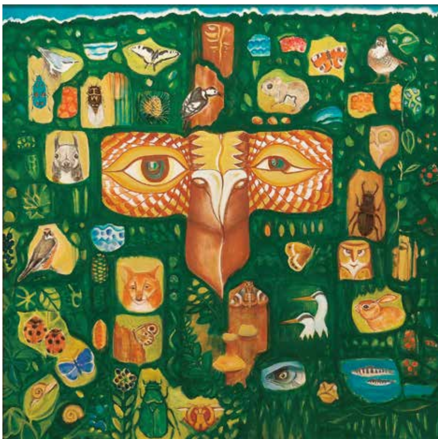
谷口一芳《森は生きている(II)》2011年

http://www.town.kutchan.hokkaido.jp/culture-sports/ogawara-museum/